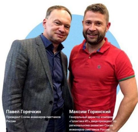
Павел Горячкин Президент Союза инженеров-сметчиков России