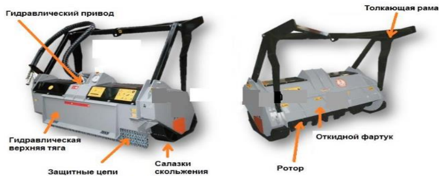
Рисунок 1. Принципиальная схема мульчера.

Разработка проектов сметных норм выполнена ПАО «НК «Роснефть»